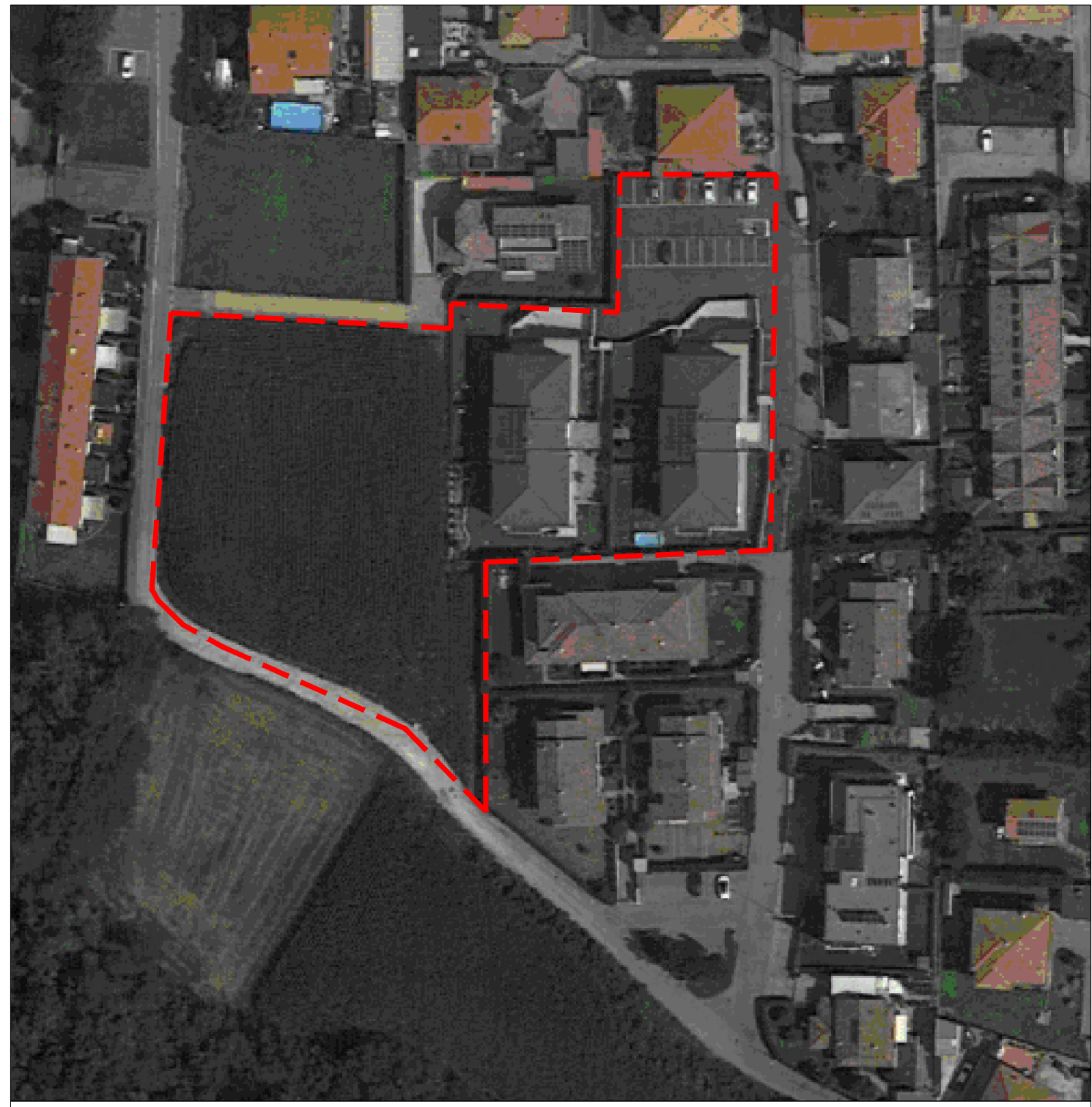
ESTRATTO MAPPA - PAV VIGENTE - AMBITO AS8